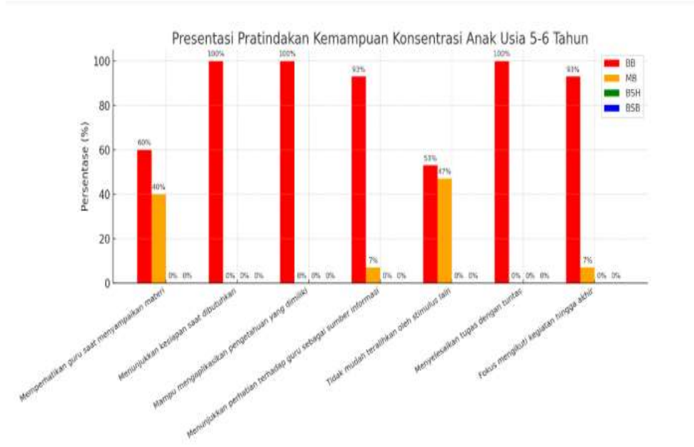
Gambar 1. Grafik Pratindakan Kemampuan Konsentrasi Anak

Dengan melihat data tersebut menunjukkan bahwa kemampuan konsentrasi anak masih harus ditingkatkan lagi, maka dilakukan perbaikan mengenai proses pelaksanaan pembelajaran sehingga mampu meningkatkan kemampuan konsentrasi anak. Berikut hasil observasi yang disajikan dalam bentuk grafik.